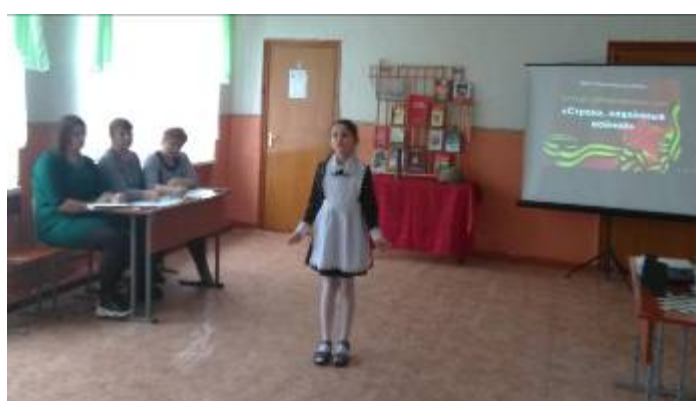
Конкурс чтецов в МОУ «Репяховская ООШ»