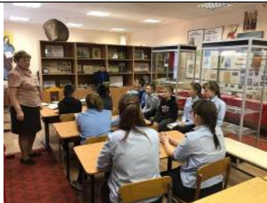
Обучающиеся Илёк-Пеньковской школы на экскурсии в школьном историко-краеведческом музее «Война была в родном краю»