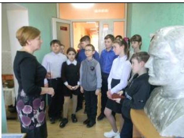
Обучающиеся Краснояружской школы №1 в историко-краеведческом музее Графовской школы