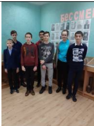
Обучающиеся Теребренской школы в историко-краеведческом музее МОУ «Графовская СОШ» в рамках экскурсионного маршрута