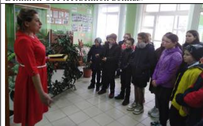
Обучающиеся Репяховской школы на экскурсии в краеведческом школьном музее