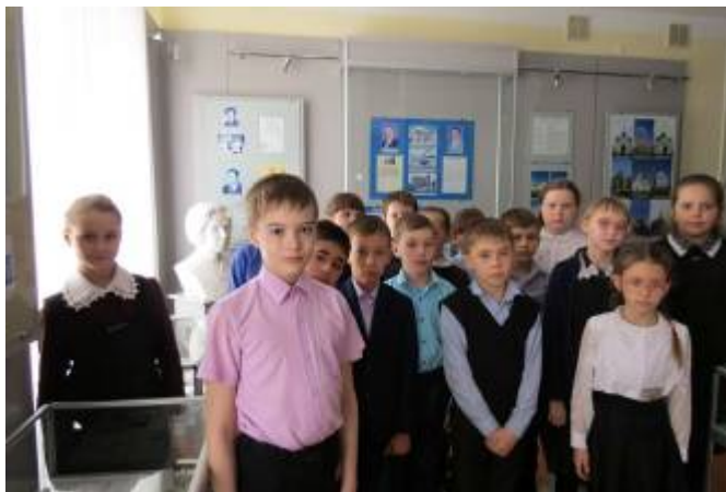
Обучающиеся 4 класса МОУ «Краснояружская СОШ №1» посетили виртуальную экскурсию «Красная Яруга в годы оккупации» в Краснояружском краеведческом музее

В период с 1 по 31 марта обучающихся Краснояружского района совершили 69 экскурсий в районный краеведческий музей и приняли участие в 20 музейных уроках с общим охватом 358 обучающихся.