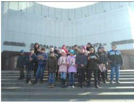
Обучающиеся МОУ «Репяховская ООШ» на экскурсии в музей-диораме