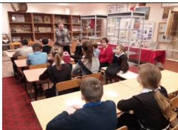
Обучающиеся Илѣк-Пеньковской школы на экскурсии в школьном историко-краеведческом музее «Школьный музей – хранитель истории»