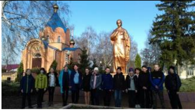
Обучающиеся Графовской школы на презентации экскурсионного маршрута «Земля, взрастившая героев»

этом мероприятии приняли участие обучающиеся всех школ района с охватом 179 детей