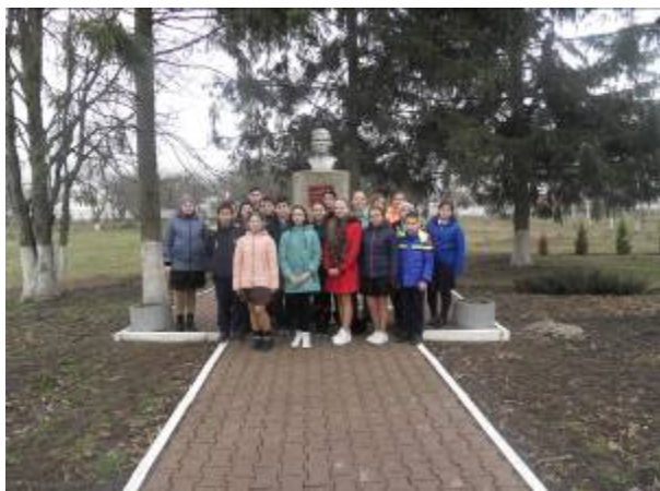
Обучающиеся старших классов Графовской школы на экскурсии в с. Репяховка в рамках экскурсионного маршрута