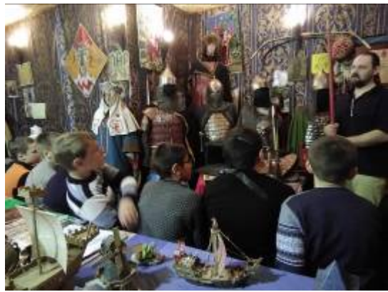
Обучающиеся МОУ «Репяховская ООШ» на экскурсии в контактном музее