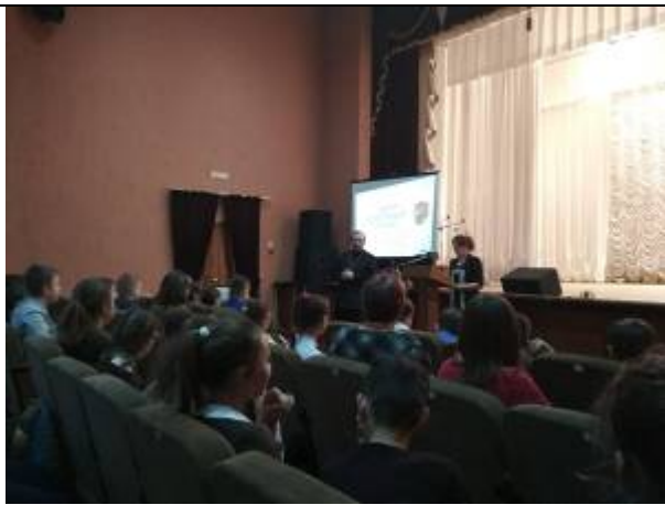
Презентация экскурсионного маршрута «Земля, взрастившая героев»