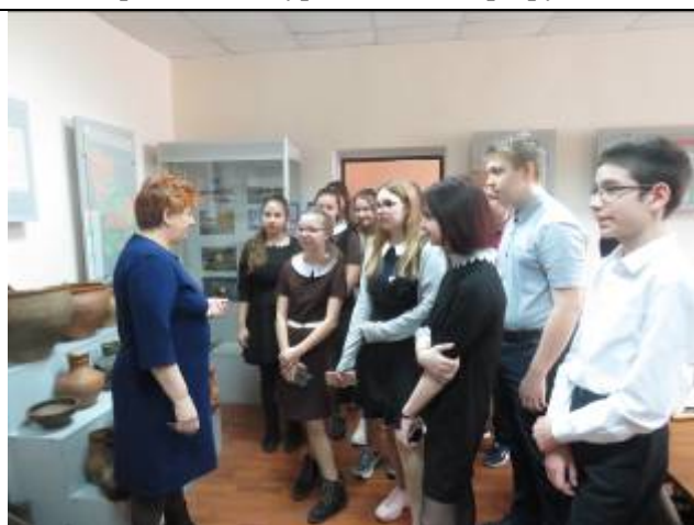
Обучающиеся Краснояружской школы №2 в музее истории с. Репяховка

Юные краеведы МОУ «Репяховская ООШ» в рамках Недели посетили Белгородские государственные музеи: Белгородский государственный историко-краеведческий музей – 1 экскурсия, в которой приняли участие 20 обучающихся; Белгородский государственный историко-художественный музей-диорама «Курская битва. Белгородское направление» – 1 экскурсии – 20 обучающихся. Остальные запланированные поездки на весенние каникулы в рамках районной недели «Музей и дети» не удалось осуществить обучающимся, они были перенесены на летние каникулы.