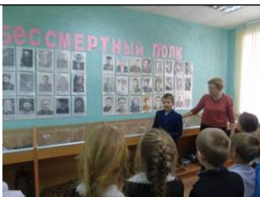
Обучающиеся Графовской школы на музейном уроке «Горжусь прадедушкой»