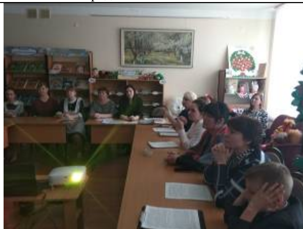
Перед началом конкурса «Моя Родословная»