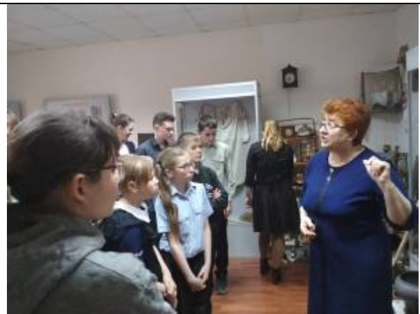
Обучающиеся Илэк-Пеньковской школы на экскурсии в музее с.Репяховка