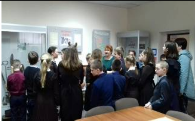
Обучающиеся Вязовской школы в музее истории с. Репяховка