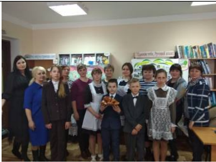
Участники конкурса «Моя родословная»