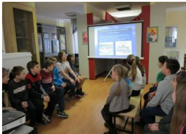
Обучающиеся 7 «Б» класса Краснояружской школы №2 на музейном уроке «Золотые звёзды Краснояружцев» Краснояружском краеведческом музее

Школьный музей открывает уникальную возможность воспитания на боевых и трудовых традициях своего народа, является широким полем творчества учащихся и педагогов, так как деятельность музеев в значительной мере связана с историей и краеведением.