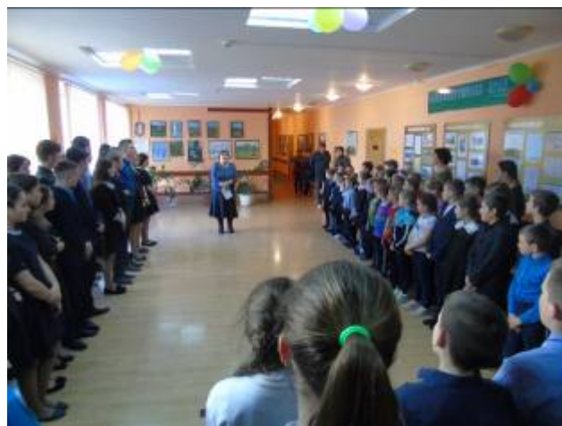
Открытие школьной недели «Музей и дети» в МОУ «Графовская СОШ»