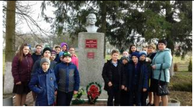
Обучающиеся Вязовской школы на презентации экскурсионного маршрута «Земля, взрастившая героев»