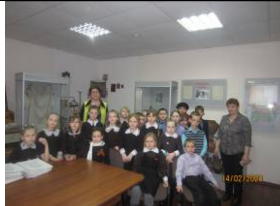
Обучающиеся младших классов Графовской школы на экскурсии в музее истории с.Репяховка