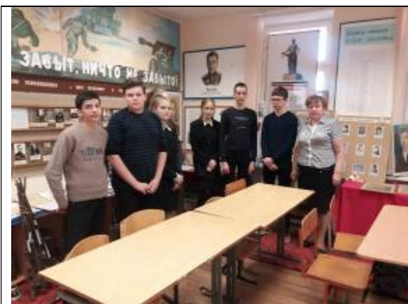
Обучающиеся Илѣк-Пеньковской школы на экскурсии в школьном историко-краеведческом музее «Моѣ село в годы Великой Отечественной войны»