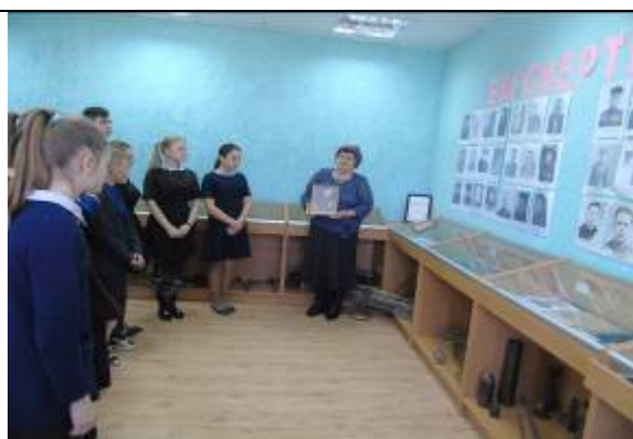
Обучающиеся Графовской школы на музейном уроке «Горжусь прадедушкой»