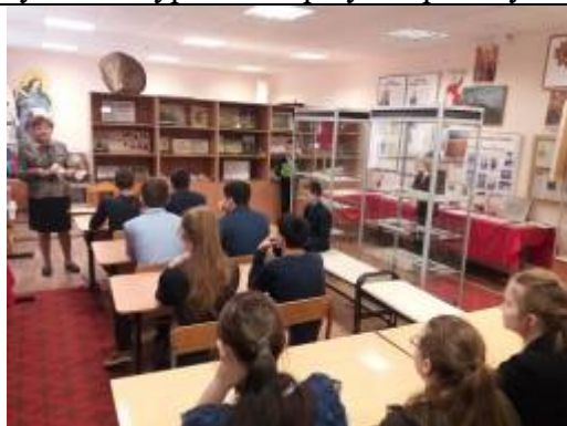
Обучающиеся Илёк-Пеньковской школы на экскурсии в школьном историко-краеведческом музее «На пути к Великой победе»