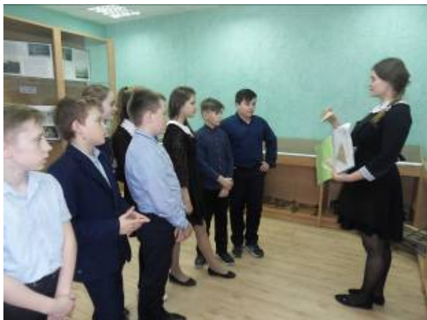
Обучающиеся Графовской школы на музейном уроке «Письмо из фронта»