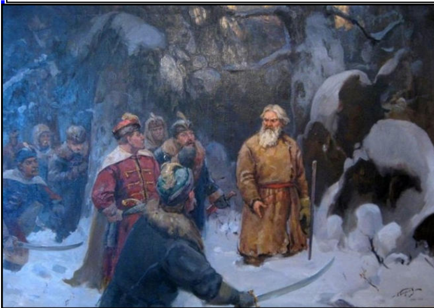
На фото картина Баранова А. «Подвиг Ивана Сусанина»

Имя Ивана Сусанина известно в России, а вот подробности его жизни, и самое важное, его подвига известны мало.